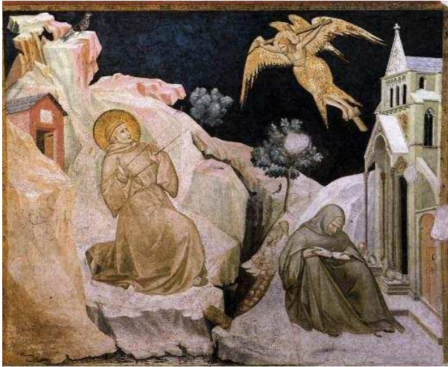
Pietro Lorenzetti: il Serafino alato che alla Verna imprime cinque ferite nel corpo di Francesco.

«Credo di avere scoperto oggi, nella ricorrenza del giorno in cui San Francesco ricevette le stimmate, qualcosa che mi ha molto commosso. Finora questa solennità m'era indifferente. Oggi, invece, leggendo sul breviario il racconto della visione fatto da San Bonaventura, sono stato colpito dal simbolismo dello spirito ardente e crocifisso che apparve a San Francesco e che lo colmò di gioie e di dolori. Non so se questo sia il significato vero del fatto prodigioso: ma, ai miei occhi, esso appare come una delle immagini e delle manifestazioni più alte che Cristo abbia dato di sé nella Chiesa; quel Cristo universale e rigeneratore uguale a quello, credo, apparso a San Paolo e di cui la nostra generazione prova un bisogno invincibile».